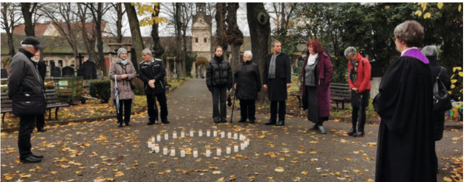
Andacht auf dem Stadtgottesacker am Ewigkeitssonntag