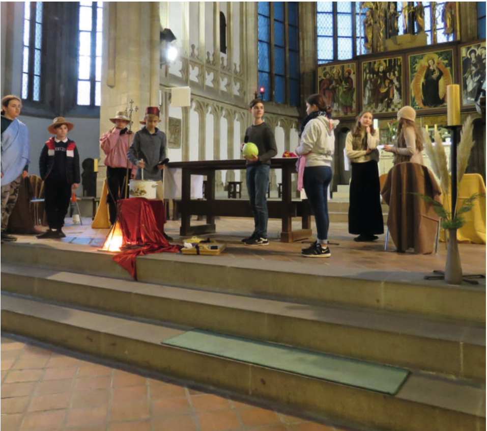
Martinsfest in der Moritzkirche