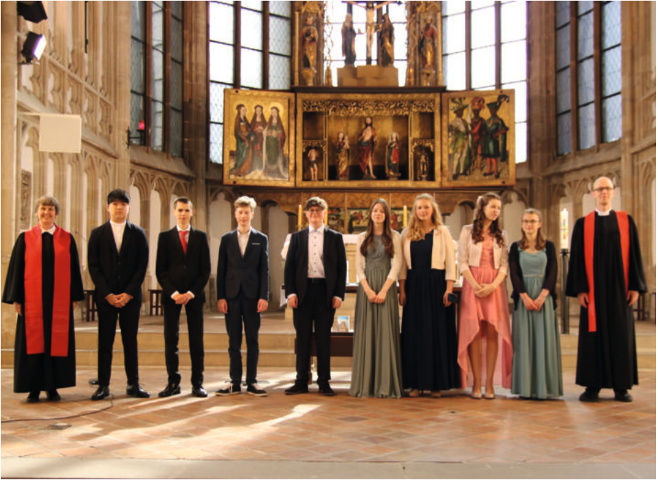
Konfirmation in der Moritzkirche