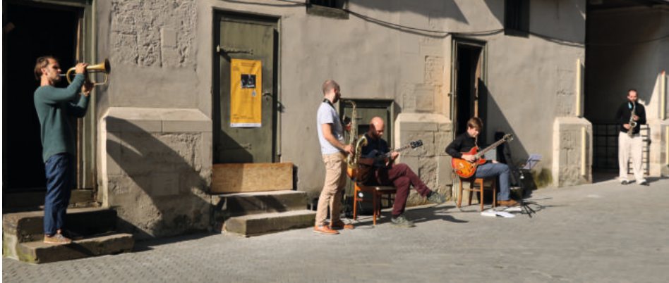
Musaik - Musik in Fugen