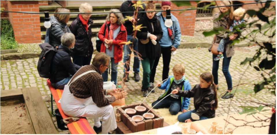
Hallisch Salz - Gott erhalt's!