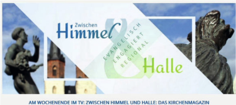
AM WOCHENENDE IM TV: ZWISCHEN HIMMEL UND HALLE: DAS KIRCHENMAGAZIN